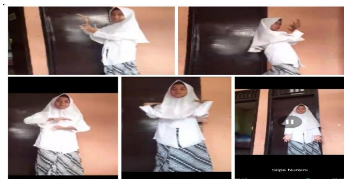
Gambar 1. Simulasi Tari Bungong Jeumpa

Sesuai hasil penelitian yang diperoleh dari wawancara semi terstruktur kepada wali kelas IV SDN 4 Caringin beserta dokumentasi pada proses pembelajaran Seni Tari yang bermuatan kedalam mata pelajaran Spdp. Pembelajaran Seni Tari di SDN 4 Caringin dilakukan secara daring atau online menggunakan aplikasi WhatsApp. Digunakannya aplikasi whatsapp ini untuk mempermudah dalam proses pembelajaran dikarenakan didalamnya dibuat sebuah grup untuk menyampaikan materi pembelajaran. Dari hasil penelitian peneliti menemukan bahwasanya dalam karakter kreatif terdapat 4 bagian diantaranya yaitu cepat dan tepat, ingin terus berubah dan memanfaatkan waktu luang, ide baru dan unik, serta luwes. Dalam pembelajaran Sbdp yang di dalamnya terdapat pembelajaran seni tari di kelas IV SDN 4 Caringin peneliti menemukan bahwasanya dalam keadaan pembelajaran daring guru dapat melihat ketepatan siswa pada gerakan dan ketepatan dalam ketukannya pada saat menari bisa dilihat dengan cara siswa diberikan tugas yaitu membuat video sedang menari.