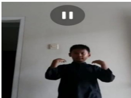
Gambar 3. Screenshoot Video Praktik Menari.

Video praktik tari Bungong Jeumpa tersebut, terdapat beberapa siswa yang mempraktikkan tarian bungong jeumpa dengan memperlihatkan gerakan yang luwes (tidak kaku). Siswa bisa dikatakan luwes dalam pembelajaran seni tari, jika gerakan yang dipraktikkan indah sesuai dengan iringan musik yang tercantum dalam tarian tersebut. Adapun sebagian siswa yang kurang luwes dalam mempraktikkan tarian bungong jeumpa disebabkan oleh kurangnya bimbingan dari orangtua, serta siswa yang kurang bersemangat juga berminat pada pelaksanaan pembelajaran seni tari.