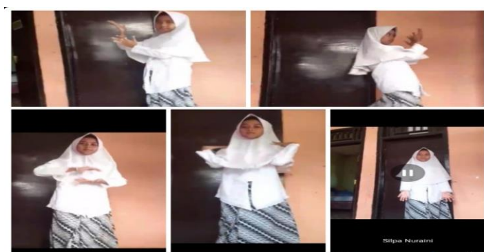
Gambar 1. Simulasi Tari Bungong Jeumpa

Sesuai hasil penelitian yang diperoleh dari wawancara semi terstruktur kepada wali kelas IV SDN 4 Caringin beserta dokumentasi pada proses pembelajaran Seni Tari yang bermuatan kedalam mata pelajaran Spdp. Pembelajaran Seni Tari di SDN 4 Caringin dilakukan secara daring atau online menggunakan aplikasi WhatsApp. Digunakannya aplikasi whatsapp ini untuk mempermudah dalam proses pembelajaran dikarenakan didalamnya dibuat sebuah grup untuk menyampaikan materi pembelajaran. Dari hasil penelitian peneliti menemukan bahwasanya dalam karakter kreatif terdapat 4 bagian diantaranya yaitu cepat dan tepat, ingin terus berubah dan memanfaatkan waktu luang, ide baru dan unik, serta luwes. Dalam pembelajaran Sbdp yang di dalamnya terdapat pembelajaran seni tari di kelas IV SDN 4 Caringin peneliti menemukan bahwasanya dalam keadaan pembelajaran daring guru dapat melihat ketepatan siswa pada gerakan dan ketepatan dalam ketukannya pada saat menari bisa dilihat dengan cara siswa diberikan tugas yaitu membuat video sedang menari.