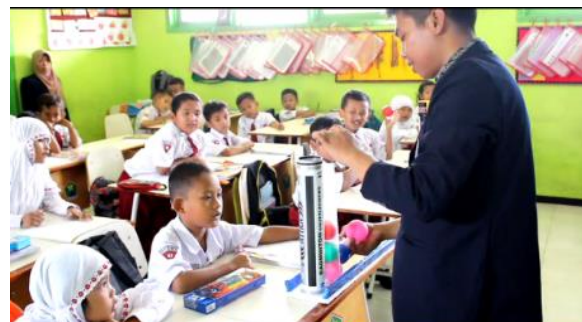
Gambar 4. Guru Model Menjelaskan Cara Penggunaan Media Tabung Pengurangan.

Peserta didik membentuk kelompok berdasarkan posisi deretan bangku, jadi kelompok yang terbentuk sebanyak 4 kelompok. Pemilihan anggota kelompok berdasarkan posisi deretan bangku mempertimbangkan ruangan yang sempit yang membatasi perpindahan peserta didik. Guru model selanjutnya membagikan masing-masing kelompok satu media tabung pengurangan, selanjutnya masing-masing dari setiap anggota kelompok diberikan kesempatan untuk mencoba menggunakan media tabung pengurangan. Setiap anggota kelompok berebut untuk mencoba menggunakan media tersebut hal ini memandakan peserta didik antusias dan termotivasi dalam proses pembelajaran yang menggunakan media tabung pengurangan. Upaya yang dilakukan oleh guru model untuk mengatasi peserta didik yang berebut untuk menggunakan media tabung pengurangan dengan menentukan