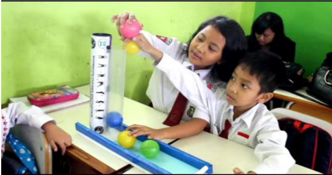
Gambar 5. Anggota Kelompok Mencoba Menggunakan Media Tabung Pengurangan

menjadi pertimbangan dalam melaksanakan tahap refleksi.