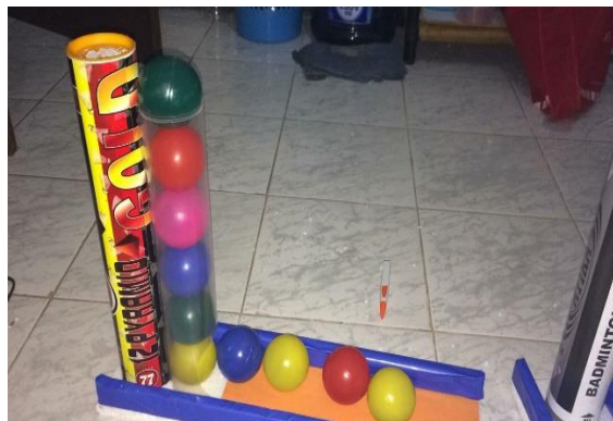
Gambar 3. Media Tabung Pengurangan

Penggunaan media dalam proses pembelajaran diperlukan untuk memudahkan peserta didik dalam memahami materi. Hasil diskusi guru model dengan teman kelompok, media yang akan digunakan merupakan media yang dapat mengaktifkan dan memotivasi peserta didik dalam mengikuti proses pembelajaran. Media yang dapat memudahkan peserta didik dalam memahami materi serta menjalin interaksi peserta didik dan peserta didik yang lainnya sehingga membiasakan peserta didik untuk kerjasama dengan teman kelompok. Berdasarkan hasil diskusi guru model dengan teman kelompok maka media yang akan digunakan merupakan media tabung pengurangan, sebagaimana yang terlihat pada Gambar 3 berikut: