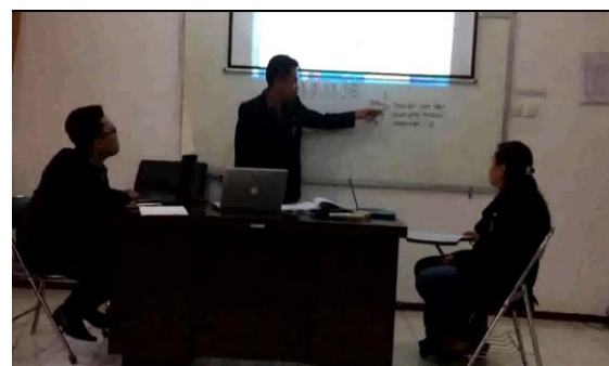
Gambar 2. Tahapan Plan Yang Dilakukan

Tahapan plan dilaksanakan pada hari Selasa tanggal 3 Oktober 2017 di gedung H3 ruangan 204 Pascasarjana Universitas Negeri Malang. Pelaksanaan plan penulis berkolaborasi dengan saudara Ryan Ristaya Shandy dan saudari Weryanti Laen Langi dalam merencanakan proses pembelajaran yang akan dilakukan. Sebagaimana yang terlihat pada gambar 2 berikut: