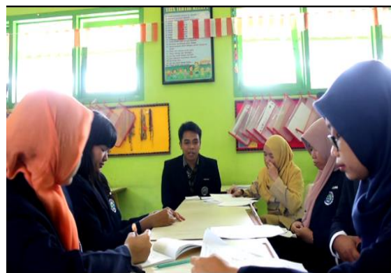
Gambar 6. Pelaksanaan Refleksi

Kegiatan berikutnya setelah semua observer menyampaikan hasil pengamatannya dan guru model memberikan tanggapan notulen menyampaikan hasil refleksi yang dilakukan sebagai berikut : (1) peserta didik antusias mengikuti proses pembelajaran. (2) interaksi guru model dengan peserta didik terjalin dua arah, (3) media pengurangan yang digunakan menarik dapat mengaktifkan peserta didik dan memudahkan menyelesaikan soal pengurangan. (4) penggunaan media perlu mempertimbangkan jumlah peserta didik. (5) jargon duduk anak saleh dan tepuk semangat dapat menertipkan peserta didik dan meningkatkan konsentrasi peserta didik mengikuti proses pembelajaran. (6) perlu memperhatikan pengelolaan waktu.