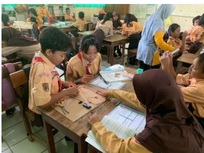
Gambar 1. Proses pembuatan rangkaian listrik seri dan paralel peserta didik kelas V

Berdasarkan gambar 1, peserta didik terlihat sedang mempraktikkan salah satu sintak model pembelajaran PjBL yaitu membuat desain proyek. Peserta didik membuat desain proyek mereka secara kelompok tentang rangkaian listrik. Dari hal tersebut terlihat bahwa peserta didik secara tidak langsung berkolaborasi dalam menyelesaikan tugas proyek yang mereka kerjakan. Pada akhirnya peserta didik menghasilkan sebuah kolaborasi yang dituangkan dalam sebuah proyek atau produk yang benar-benar orisinal dari mereka.