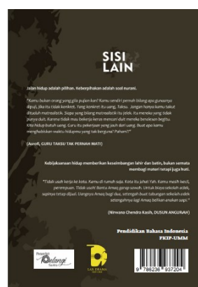
Gambar 2: Produk Buku Kumpulan Naskah Drama ber-ISBN

Antologi Naskah Drama SISI LAIN Penerbit: Anon! Mawaddah | Devi Kerdhiani | Marissa | Laila | Rano | Nuzul | Hasan Waj | Da Prasteti | Nurwana Chandra | Kashi Putri Dah Ayu Pituloka Editor: Candra Rahma Wijaya Putra | Harti Sutaryo Cetakan Pertama, 2021 214 x 297 cm, viii + 101 hal Penyunting Sampul: Yuhani Nur Saifati Lay-out: Candra Rahma Wijaya Putra Dibagikan atas Kerjasama: Program Studi Pendidikan Bahasa Indonesia FKIP UMSI, Lahore Jawa Timur FKIP UMSI, dan Penerbit Pelangi Sarta Surel: penerbitpelangisarta@gmail.com Instagram: @penerbitpelangi Twitter: @penerbitpelangi Facebook: Penerbit Pelangi Sarta http://www.penerbitpelangisarta.com ISBN: 978-623-097-20-4