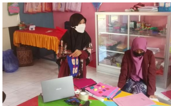
Gambar 3: Pelaksanaan pelatihan pembuatan cloth book educative

Tahapan ketiga yaitu pelatihan dan pendampingan. Pelatihan berupa demonstrasi pembuatan cloth book educative sebagai media pembelajaran dilaksanakan pada hari Sabtu, tanggal 11 September 2021, yang kemudian dilanjutkan dengan pendampingan pembuatan media pembelajaran cloth book educative terkhusus untuk materi pengenalan bilangan dan geometri selama 2 (dua) pekan sampai dengan tanggal 25 September 2021 yang menghasilkan 6 (enam) buah cloth book educative yang nantinya dapat digunakan guru-guru di TK 23 PGRI Rawang Bababulo, Majene dalam pelaksanaan pembelajaran.