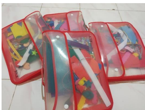
Gambar 1: Tahapan persiapan pelaksanaan pelatihan

Tahapan kedua yaitu tahap persiapan. Pada tahapan ini dihasilkan modul pelatihan pembuatan cloth book educative yang berisi beberapa tema yang dapat digunakan untuk materi pengenalan bilangan dan bentuk-bentuk bangun datar diantaranya tema kantong membilang, mencocokkan pola bangun datar, sempoa, memetik dan menghitung buah mangga, dan memasang dan menghitung kancing baju. Tahapan ini juga menghasilkan video tutorial pembuatan cloth book educative .