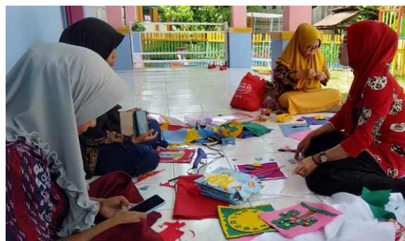
Gambar 4: Pendampingan pembuatan cloth book educative