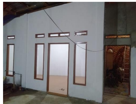
Gambar 3. Pembangunan fasilitas rumah pengemasan/showroom ikan salai patin di UMKM Putra Niaga