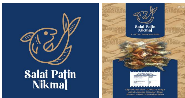
Gambar 1. Logo dan desain kemasan “Salai Patin Nikmat”

Berikut ini logo dan desain kemasan “Salai Patin Nikmat” (Gambar 1).