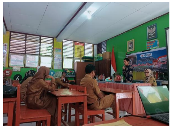
Gambar 4. Kegiatan sinkronus

Kegiatan dilaksanakan menggunakan dua metode yaitu metode sinkronus dan asinkronus . Metode sinkronus adalah pemberian pelatihan secara tatap muka kepada guru-guru yang dilaksanakan di SDN No. 60 Inpres lembang pada Bulan Juni 2023.