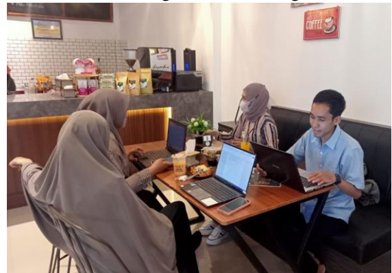
Gambar 3. Pembuatan Administrasi

Sebelum pelaksanaan pengabdian terlebih dahulu dilakukan pengurusan dan pembuatan administrasi. Administrasi yang dibutuhkan adalah surat tugas pengabdian, daftar hadir serta angket evaluasi kegiatan.