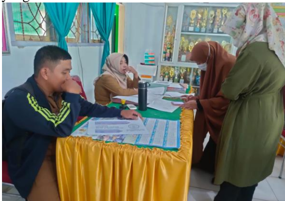
Gambar 1. Koordinasi dengan Mitra

Koordinasi mitra dilakukan untuk menentukan jadwal pengabdian yang dilaksanakan secara sinkronus atau memberikan pelatihan secara langsung kepada guru serta memberikan gambaran mengenai tema pelatihan yang akan diberikan.