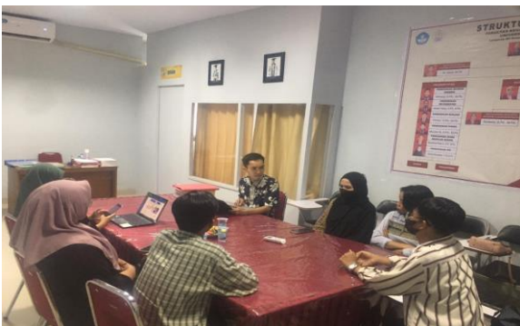
Gambar 2. Rapat Koordinasi

Tahapan berikut yang dilakukan setelah koordinasi dengan mitra yaitu rapat bersama tim pengabdian untuk membahas persiapan yang dibutuhkan sebelum pelaksanaan kegiatan. Rapat Koordinasi dihadiri oleh tiga dosen dan lima mahasiswa.