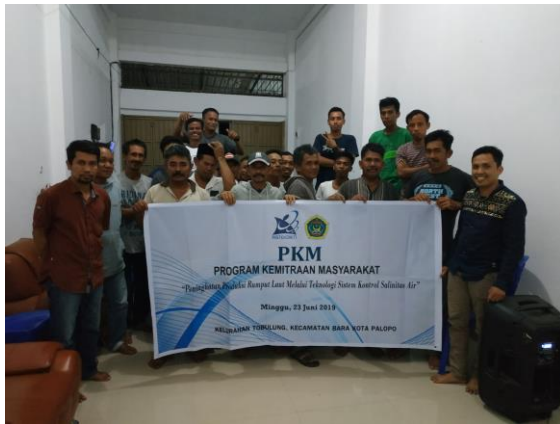
Gambar 2: Foto bersama pasca pelatihan pengenalan teknologi mikro-kontroler untuk rumput laut

Selain membawakan materi, narasumber juga mendemokan cara pengolahan pembuatan jus rumput laut. Para peserta antusias menyimak tatacara pembuatan jus rumput laut. Para peserta juga mendemokan langsung cara pembuatan jus rumput laut.