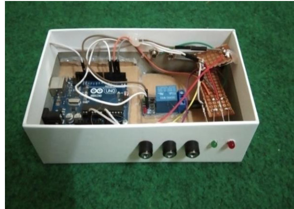
Gambar 3. Alat kontrol salinitas air