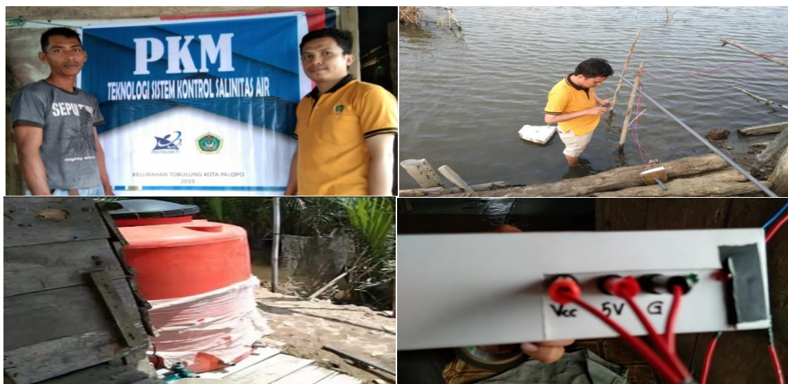
Gambar 4. Lokasi pemasangan alat