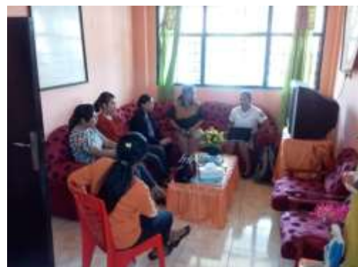
Gambar 3.1. Perencanaan jadwal kegiatan PKM bersama ketua tim, anggota dan guru-guru di sekolah mitra.

Kegiatan ini bertujuan untuk merencanakan jadwal kegiatan PKM bersama ketua tim, anggota dan guru-guru di sekolah. Kegiatan ini dilaksanakan pada tanggal 27 Maret 2019 dengan cara ketua tim dan anggota mendatangi guru-guru di sekolah SMPK Sint Vianney Soe yang beralamat di JLN. I Gusti Ngurah Rai, Kelurahan Kampung Baru, Kecamatan Kota Soe Kabupaten TTS, Provinsi Nusa Tenggara Timur (NTT). Dalam pertemuan ini dinformasikan secara terperinci jenis-jenis kegiatan yang akan dilakukan dalam PKM ini. Hasil dari pertemuan ini adalah adanya kesepakatan untuk melakukan kegiatan awal pada tanggal 27 Maret 2019. Jenis kegiatan yang akan dilakukan pada kegiatan awal ini bertujuan mengarahkan guru untuk melakukan perencanaan proses pembelajaran dalam sistem Lesson Studi learning Comunity (LSLC) . Kegiatan tersebut adalah sosialisasi tentang LSLC dan jenis-jenis pendekatan, model, dan strategi pembelajaran yang dapat digunakan untuk mengembangkan kegiatan pembelajaran dalam sistem LSLC . Adapun pendekatan, model, dan strategi pembelajaran yang akan digunakan tersebut memenuhi standar proses pembelajaran yang dicanangkan dalam kurikulum 2013. Kegiatan-kegiatan selanjutnya dalam PKM akan direncanakan pada pertemuan berikutnya karena harus disesuaikan dengan waktu tim pelaksana dan guru-guru di sekolah. Dokumentasi saat melaksanakan perencanaan awal dapat ditampilkan pada gambar 3.1.