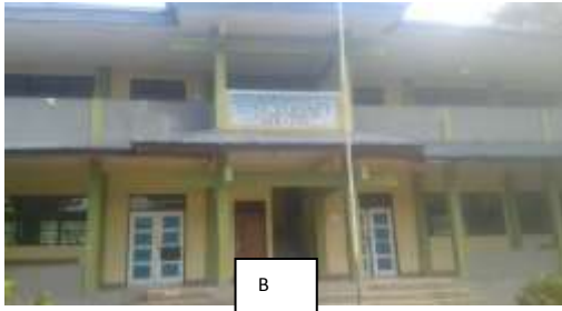
Gambar . 1A) Alat laboratorium yang terdapat dalam kelas, dan ditata seadanya