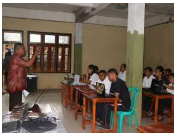
Gambar 3.2. Dokumentasi Seminar tentang pelaksanaan sistem LSLC , Pengembangan Perangkat Pembelajaran, dan instrumen penilaian yang memenuhi standar proses dan standar penilaian dalam kurikulum 2013.