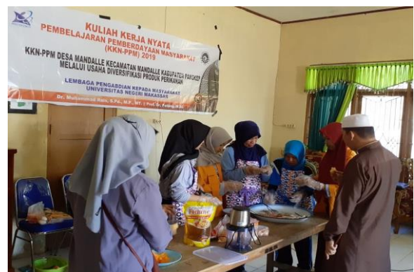
Gambar 5. Simulasi Pembuatan Nugget