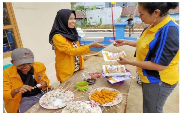
Gambar 6. Uji Rasa dan Bentuk Nugget dan Bakso Ikan