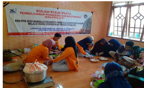
Gambar 4. Simulasi Pembuatan Nugget