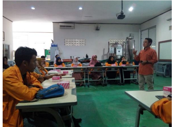
Gambar 1. Orientasi diversifikasi produk Perikanan

Sebelum pelatihan dilakukan pada masyarakat, terlebih dahulu dilakukan pembekalan pada mahasiswa dan tim yang akan melakukan kegiatan diversifikasi produk perikanan. Pembekalan dilakukan dalam bentuk pelatihan pembuatan surimi ikan bandeng sebagai bahan pembuatan nugget dan bakso ikan. Pelatihan ini dilakukan di laboratorium Pendidikan Teknologi Pertanian Fakultas Teknik Universitas Negeri Makassar. Sebanyak 25 orang mahasiswa dilatih untuk memberi pelatihan pada masyarakat di desa Mandalle. Pelaksanaan pelatihan bagi Masyarakat desa Mandalle menggunakan metode partisipasi aktif melalui pembelajaran aktif. Setiap masyarakat dapat diberi kesempatan mempraktekkan cara membuat surimi untuk bahan dasar nugget dan bakso ikan. Pelatihan di laboratorium dilakukan sebagai upaya memberi bekal pengetahuan keterampilan yang cukup bagi mahasiswa untuk melatih masyarakat.