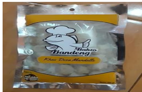
Gambar 7. Nugget dan Bakso Ikan dalam Kemasan