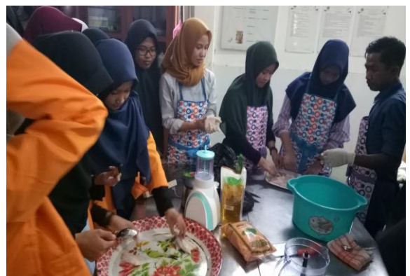
Gambar 2. Simulasi diversifikasi produk Perikanan di Kampus

Data hasil pelatihan bagi masyarakat berupa evaluasi terhadap pengetahuan dan keterampilan membuat nugget ikan dan bakso ikan bandeng. Data diperoleh dengan melakukan wawancara dan curah pendapat terhadap mitra ibu-ibu dan remaja. Hasilnya dianalisis secara deskriptif. Secara ringkas alur pelatihan pembuatan nugget dan bakso ikan ditunjukkan dalam gambar berikut: