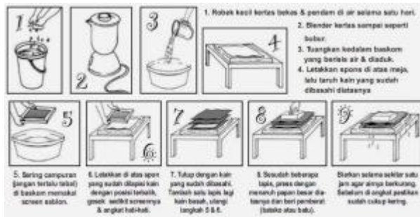
Gambar 3. Daur Ulang Kertas