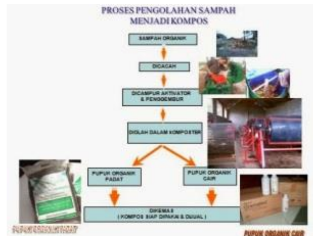
Gambar 1. Pengolahan Sampah menjadi kompos

Pupuk kompos dibuat dari limbah organik dengan prinsip penguraian bahan-bahan organik menjadi bahan anorganik oleh mikroorganisme melalui fermentasi. Bahannya berupa dedaunan atau sampah rumah tangga yang lain, serta kotoran ternak (sapi, kambing, ayam). Mikroorganisme yang berperan dalam pembuatan kompos dikenal sebagai effective microorganism (EM). EM terdiri atas mikroorganisme aerob dan anaerob. Kedua kelompok jasad renik tersebut bekerja sama menguraikan sampah-sampah organik. Hasil fermentasinya dapat menciptakan kondisi yang mendukung kehadiran jamur pemangsa nematoda (cacing parasit pada akar tanaman). Kompos digunakan dalam sistem pertanian, bersifat ramah lingkungan, dan hasil panen dari tanaman pertanian yang menggunakannya memiliki harga jual yang lebih mahal. Dengan memanfaatkan pupuk organik, di samping menanggulangi limbah, berarti juga menerapkan gaya hidup sehat. Berikut ini proses pengolahan sampah menjadi kompos.